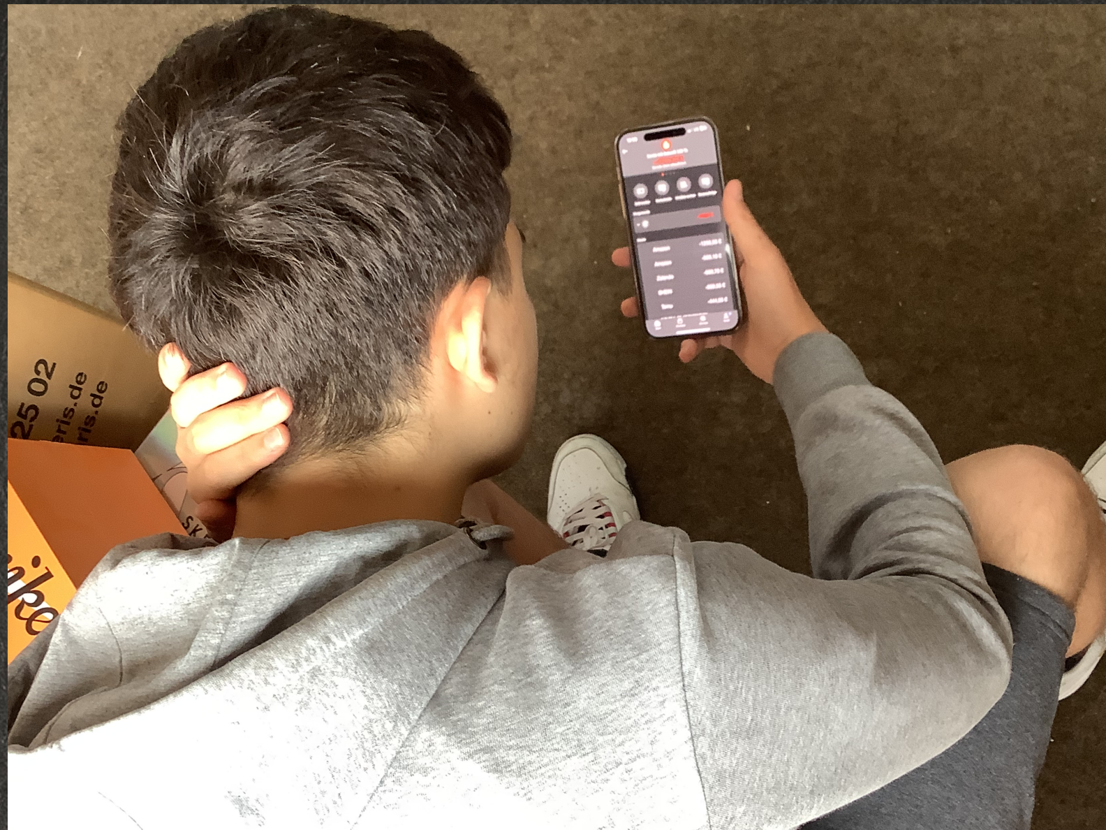
Tom schaut verzweifelt auf seinen Kontostand.