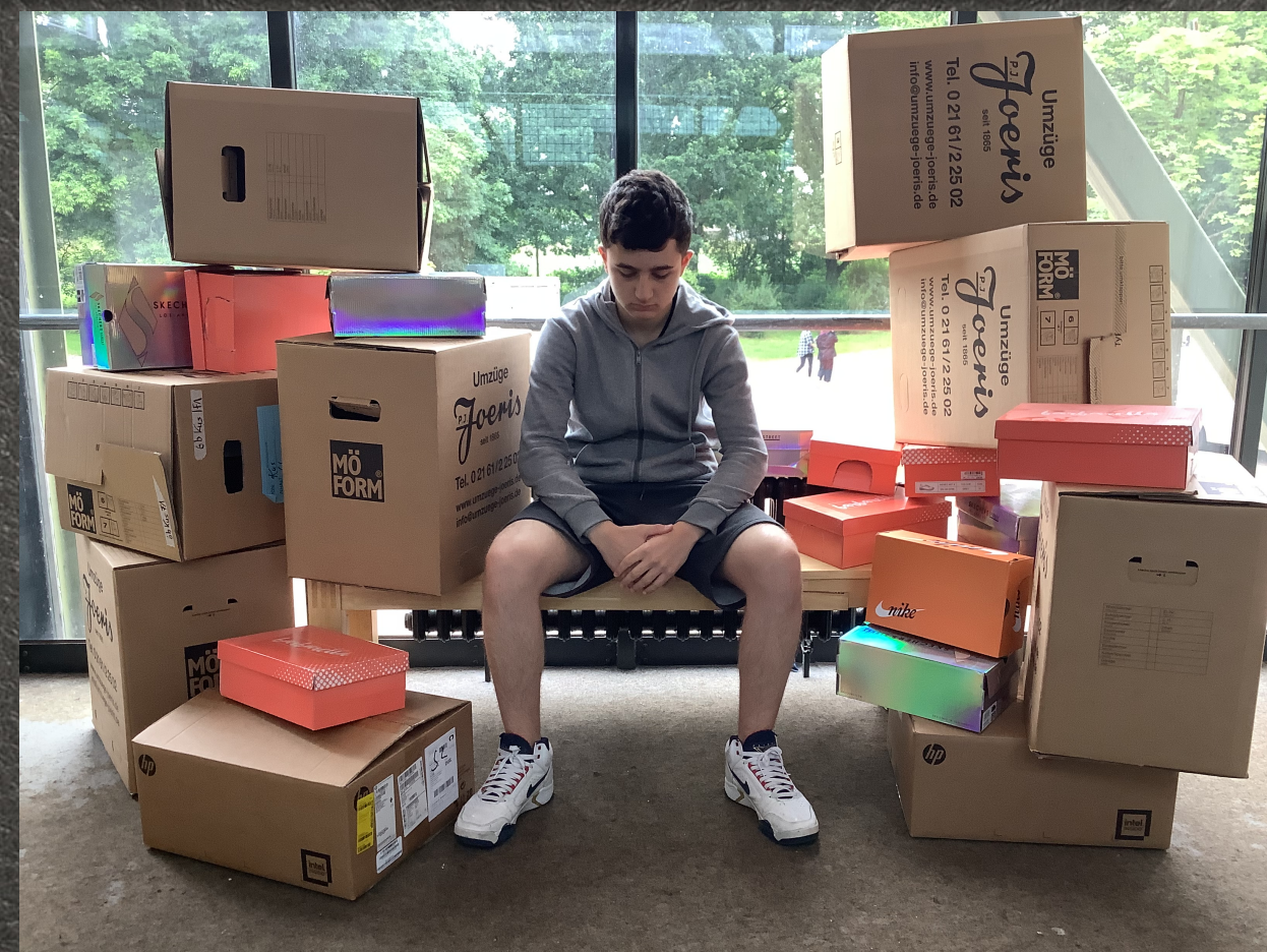
Tom ist verzweifelt und weiß nicht, was er machen soll.